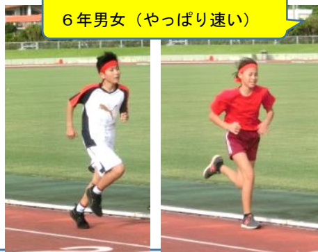
6年男女 (やっぱり速い)