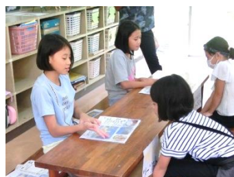
この国はいかがでしょう