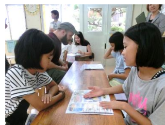
こちらはおすすめですよ