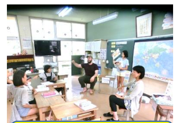
ツーリストの开店です