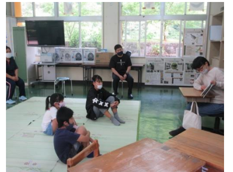
オリエンテーションのようす