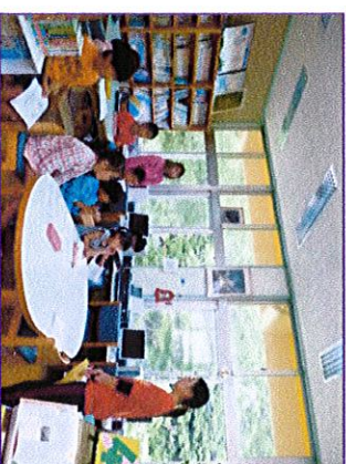
オリエンテーションの様子