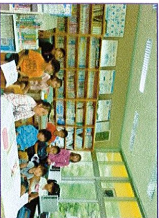
オリエンテーションの様子