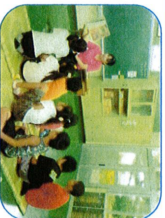
親奮祖さん・泥かぶらと、からあげの本を読んでもらいました