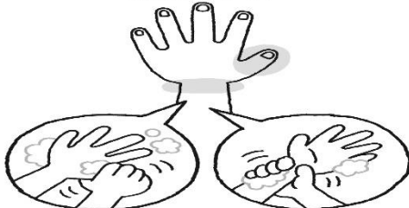
反対の手でねじる