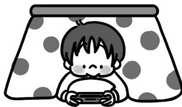
運動 うんどう しない子