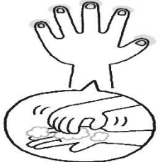
手のひらでこする