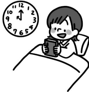
夜 よ ふかしする子