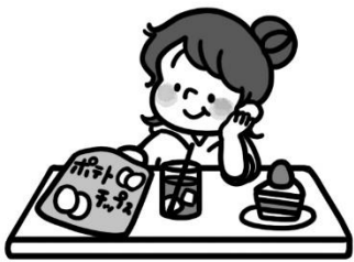
好きなものばかり 食べている子